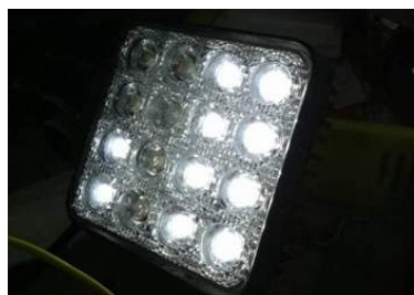
▲作業灯の点灯不良