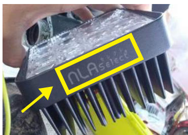
▲NLAセレクトのロゴのお写真

不良品が発生しない様に極力注意し商品の販売を行って参りますが、作業灯ご購入の際に商品の保証に関してはご安心いただけるよう、上記のように設定しております。 LED ライト各商品に関しましても同様の保証を致します。 商品に不具合があった場合、お写真を送り頂いてから、 およそ 2 ~ 3 営業日で代替りの商品を手配する様にしております。